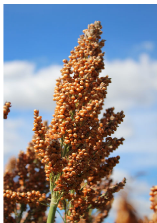
Panicule ES FOEHN